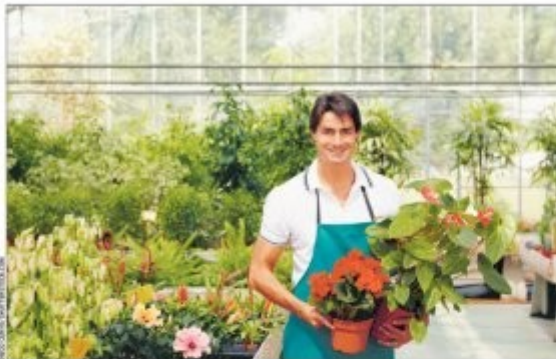
Z dotacji unijnych doskonale korzystają właściciele małych i średnich firm

Europejski Fundusz Społeczny (EFS) daje możliwość podnoszenia kwalifikacji zawodowych osobom pracującym, pomaga bezrobotnym w znalezieniu pracy i podniesieniu ich umiejętności zawodowych, przeszedłszy dyscyplinę zawodową (np. kobiet, które chcą być aktywne zawodowo) oraz daje wsparcie przy poszukiwaniu zatrudnienia przez osoby niepełnosprawne. Europejski Fundusz Społeczny pomaga rozwijać kwalifikacje osób, zwłaszcza tych, które mają szczególne trudności z znalezieniem pracy, utrzymaniem dotychczasowej, czy powrotem do pracy po dłuższej przerwie.