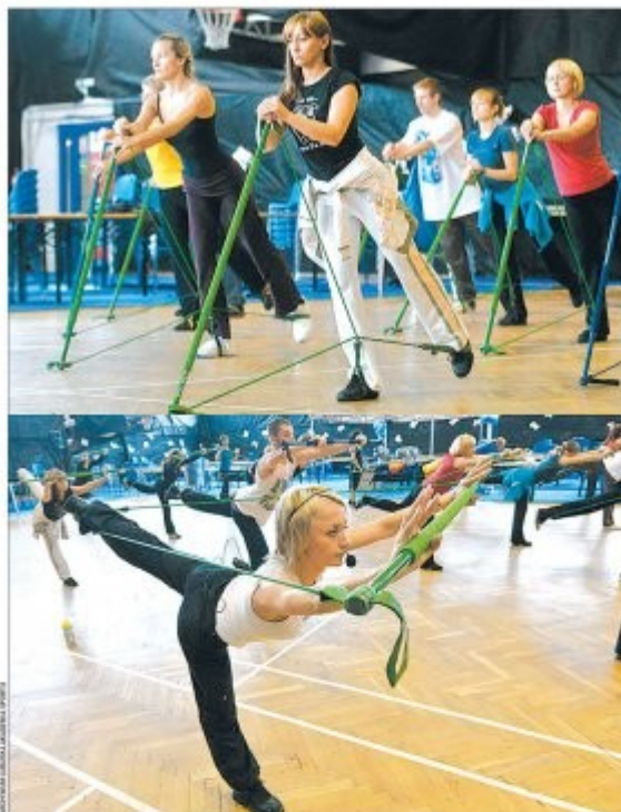
Dobrze wydane pieniądze służą aktywizacji ludzi w każdym wieku

doktorantów i staży postdoktorskich, projekty kierowane do studentów niepełnosprawnych w celu umożliwienia im korzystania z pełnej oferty edukacyjnej uczelni, projekty wsparcia stypendyjnego dla studentów podejmujących kształcenie na tak zwanych kierunkach „zamawianych” – kierunkach o kluczowym znaczeniu dla gospodarki opartej na wiedzy, a więc przede wszystkim na kierunkach technicznych, matematycznych i przyrodniczych, organizację konferencji, seminariów i spotkań panelowych z udziałem przedstawicieli uczelni oraz przedsiębiorców, które służą wymianie doświadczeń oraz wypracowaniu propozycji rozwiązań kluczowych problemów w szkolnictwie wyższym, organizację kursów, szkoleń i studiów podyplomowych w zakresie zarządzania badaniami naukowymi i pracami rozwojowymi.