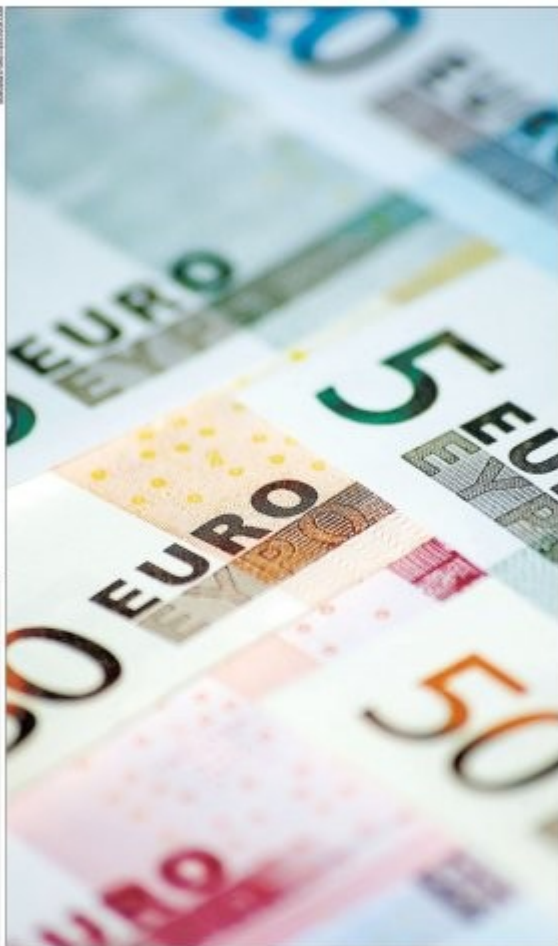
Warto dowiedzieć się, o jakie pieniądze na jakie szkolenia możemy się starać

www.efs.dolny-slask.pl tel. (071) 782 92 00 www.202.204. Infolinia: 0 800 700 337 e-mail: promocja@dwup.pl www.pokl.dwup.pl www.efs.dwup.pl