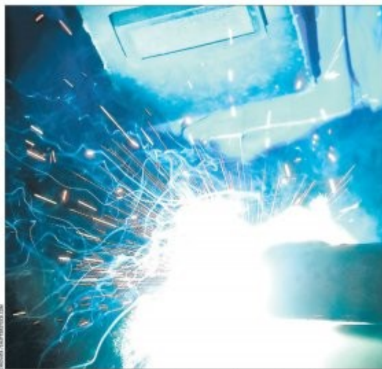
Przedstawiciele koncernów samochodowych z całego świata chętnie tutaj inwestują

Dodatkowym atutem ekonomicznym regionu są istniejące na jego terytorium trzy specjalne strefy ekonomiczne: Wałbrzyska Specjalna Strefa Ekonomiczna INVEST - PARK, Kamiennogórska SSE Małej Przedsiębiorczości oraz Legnicka Specjalna Strefa Ekonomiczna (LSSE).